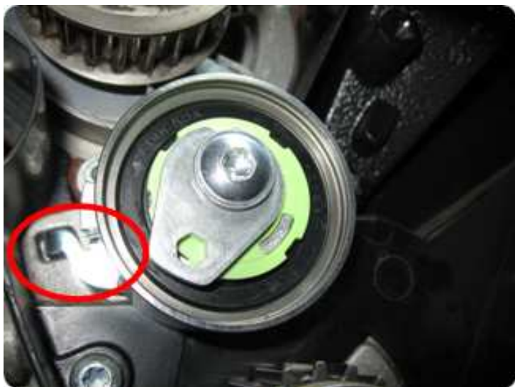
1. sz. kép