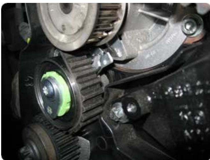
2. sz. kép