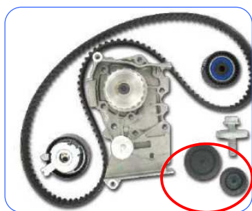
Ex: VKMC 06020

A fentebbi Renault motorokon végzett vezérléscsere során a szétszereléskor a két műanyag fedél megsérül vagy teljesen tönkremegy.