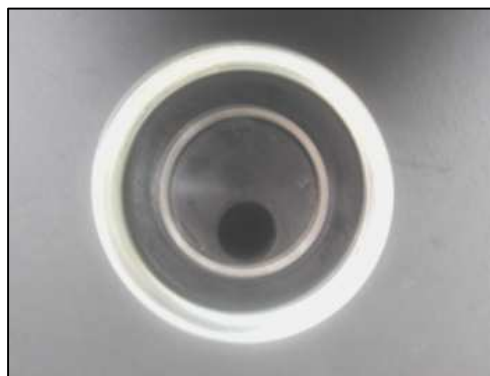
SKF gyártmány (RENAULT 77 00 736 085-vel megegyezik)