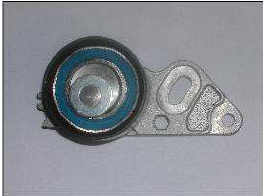
OE REF: 11040187 Szíjtárcsa átmérője: 62 mm Négyzetes furat az állításhoz