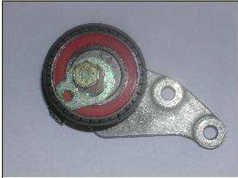
OE REF: 1039422 Szíjtárcsa átmérője: 60 mm Állítócsavar a szíjtárcsán