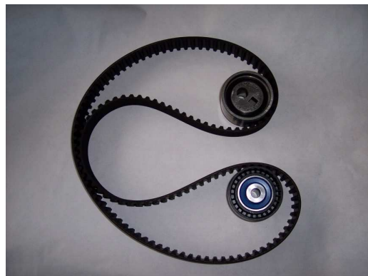
Új SKF VKMA 03244 / 03247 tartalma