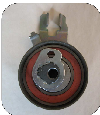
← Előző kialakítás (csap nélkül)