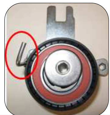
→ Legújabb kialakítás (csappal)